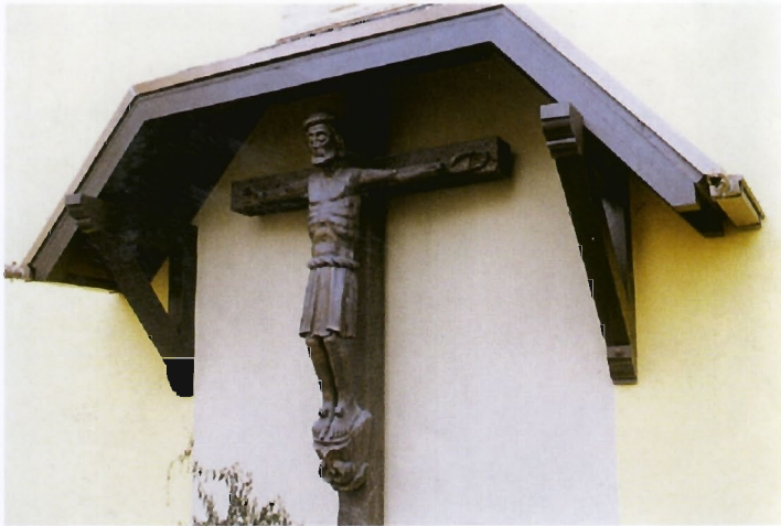
Wegekreuz an der Siechenhauskapelle geschaffen vom Essener Bildhauer Zangele

Über fünf Jahrhunderte sind nun über das Kirchlein hinweggeflutet, so daß wir in ihm das älteste Wahrzeichen Rüttenscheids besitzen. Zugleich eines der ältesten Kulturdenkmäler Essens.