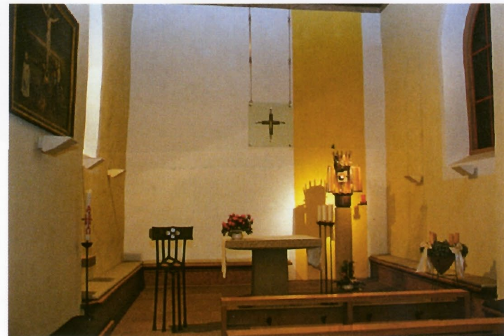
Altarraum der Kapelle

Die älteste Urkunde vom Essener Siechenhaus stammt aus dem Jahre 1410. In ihr wird berichtet von dem Verkauf einer Jahresrente von sechs Schillingen der Witwe Johann von Linden und ihrer drei Kinder aus ihrem in Essen bei der Mauer gelegenen Hause, von denen drei Schilling „to nutte ind to behove des sekenhuses bufen Effinde boven dem Calkhove to beteringhe des huses“ werden sollen. Zu dem Siechenhof gehörten das Siechenhaus mit Hofraum, ein kleiner und großer Garten, ein