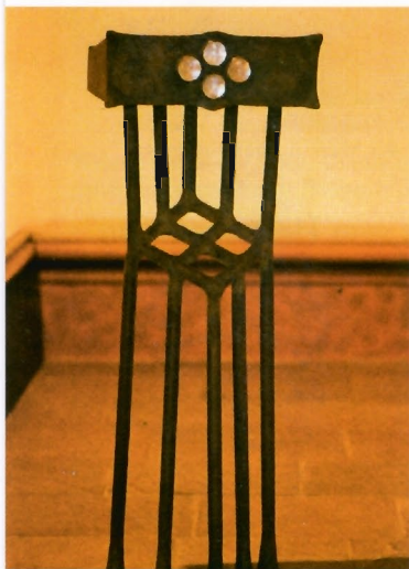
Ambo/Lesepult mit 4 Bergkristallen Entwurf: Helge Kühnapfel, Velbert Spende der SPARKASSE ESSEN

Ein halbes Jahr später, am Vorabend des 1. Mai 1971, wurde dann die Kapelle durch Bischof Dr. Franz Hengsbach offiziell zur Anbetungskapelle erhoben. Zuvor zelebrierte der Bischof eine heilige